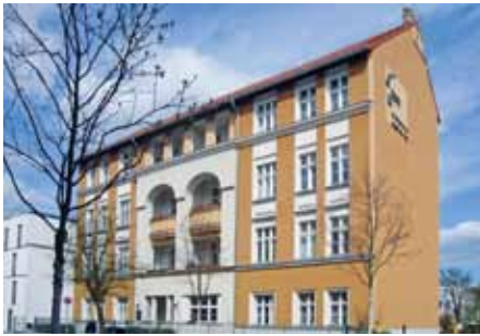
Gründungshaus in der Hämmerlingstraße 99

Mitten im Herzen von Berlin-Köpenick, gleich neben unserem Gründungshaus in der Hämmerlingstraße 99 und unmittelbar am Wuhlewanderweg entsteht unser neuer „Wohnpark am Wuhle-Ufer“.