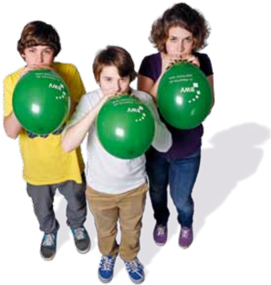
Wohnen für Generationen