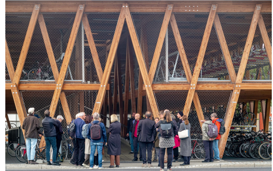
Sonderpreis des Brandenburgischen Baukulturpreises 2023: Fahrradparkhaus Eberswalde, Leitplan mit ifb frohloff staffa kühl ecker, Berlin

Beiträge AG Architektur+Schule, Brandenburgische Architektenkammer Brandenburgischer Handwerkskammertag BTU Cottbus-Senftenberg FG Stadtmanagement Bund Deutscher Architektinnen und Architekten Brandenburg