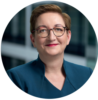
Klara Geywitz Bundesministerin für Wohnen, Stadtentwicklung und Bauwesen