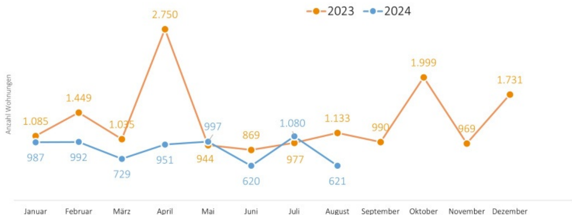
Monatliche Entwicklung in Berlin Genehmigte Wohnungen* im Vorjahresvergleich

*Baugenehmigungen für Wohnungen im Wohn- und Nichtwohnbau einschließlich Baumaßnahmen an bestehenden Gebäuden