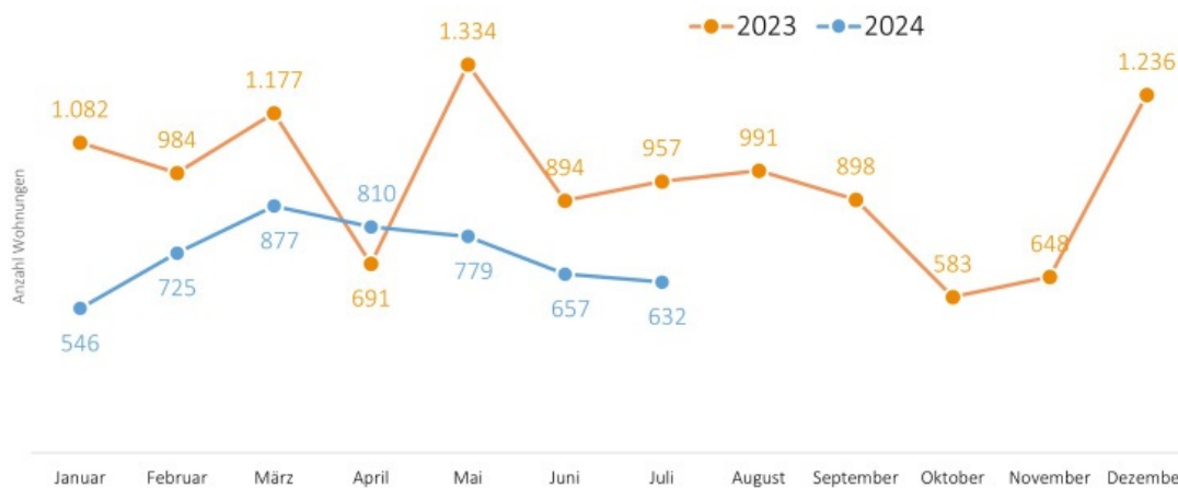
Monatliche Entwicklung der Baugenehmigungen im Land Brandenburg Genehmigte Wohnungen* im Vorjahresvergleich

*Baugenehmigungen für Wohnungen im Wohn- und Nichtwohnbau einschließlich Baumaßnahmen an bestehenden Gebäuden