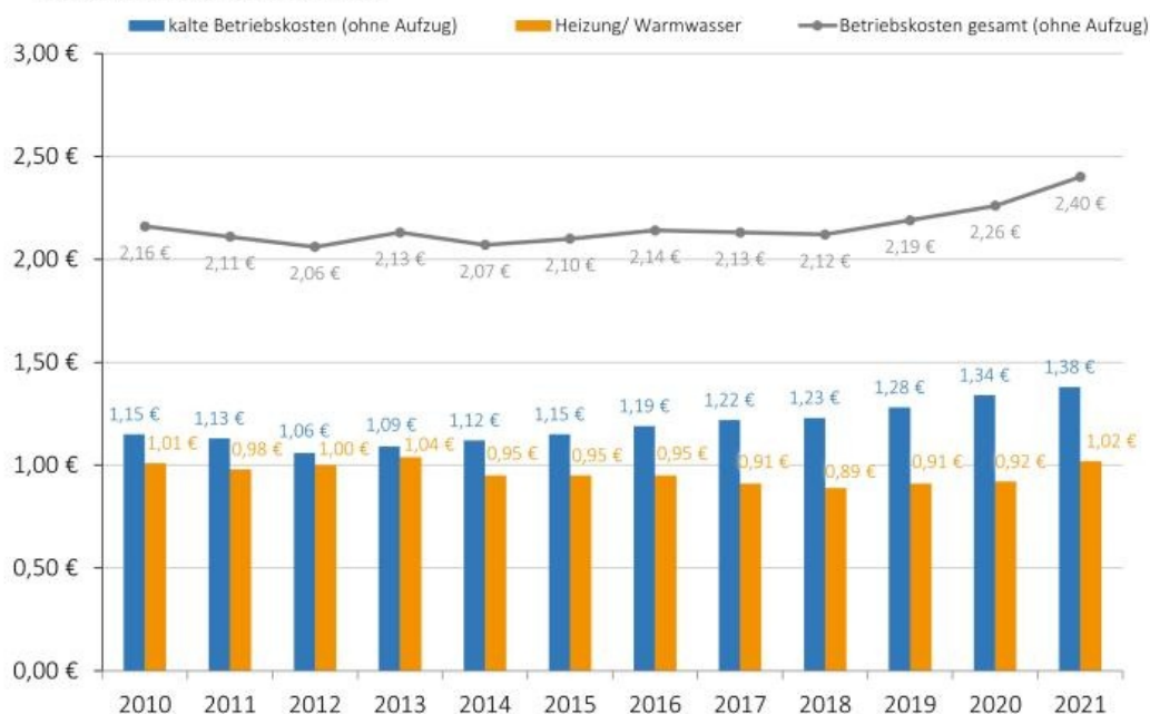
Land Brandenburg: Abgerechnete Betriebskosten im Unternehmensdurchschnitt der teilnehmenden BBU-Mitgliedsunternehmen in Euro je Quadratmeter Wohnfläche im Monat, Zeitraum: 2010-2021

Um eine erweiterte Übersicht über die Entwicklung der abgerechneten Betriebskosten im Jahr 2021 zu erhalten, empfiehlt sich durchaus ein ergänzender Blick in die berlinnahen Regionen wie das Berliner Umland oder in die berlinferneren Regionen wie den Weiteren Metropolitanraum . Auch die Entwicklung der abgerechneten Betriebskosten in Berlin ist durchaus interessant.