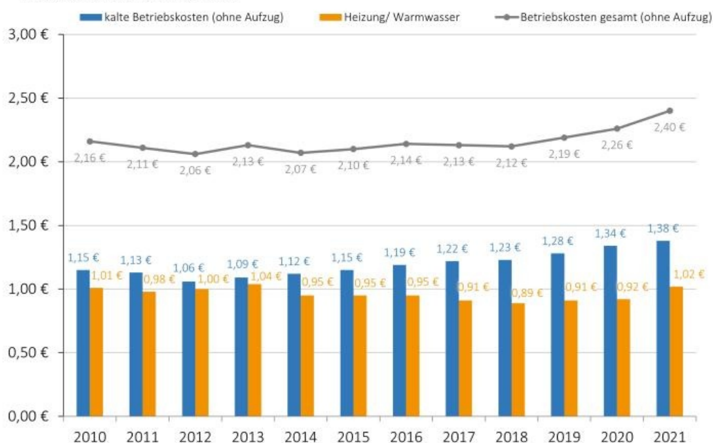
Land Brandenburg: Abgerechnete Betriebskosten im Unternehmensdurchschnitt der teilnehmenden BBU-Mitgliedsunternehmen in Euro je Quadratmeter Wohnfläche im Monat, Zeitraum: 2010-2021

Um eine erweiterte Übersicht über die Entwicklung der abgerechneten Betriebskosten im Jahr 2021 zu erhalten, empfiehlt sich durchaus ein ergänzender Blick in die berlinnahen Regionen wie das Berliner Umland oder in die berlinferneren Regionen wie den Weiteren Metropolitanraum . Auch die Entwicklung der abgerechneten Betriebskosten in Berlin ist durchaus interessant.